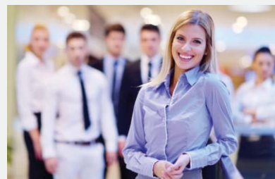
Správce zodpovídající za zabezpečení