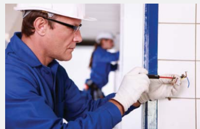
pro montážní techniky