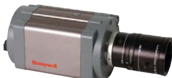
Cámara megapixel HCX3