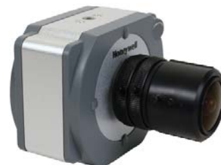
Cámara megapixel HCX13M