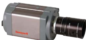
Cámara megapixel HCX5D

Acerque el zoom en cualquier parte de la imagen para revelar detalles fundamentales.