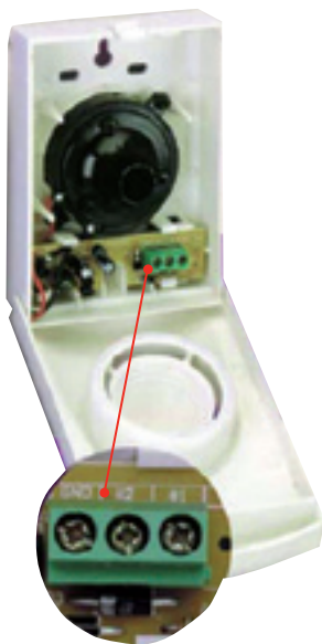
Sin soldaduras ni empalmes