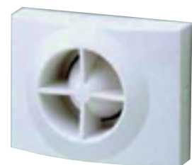
Montaje en "corner"