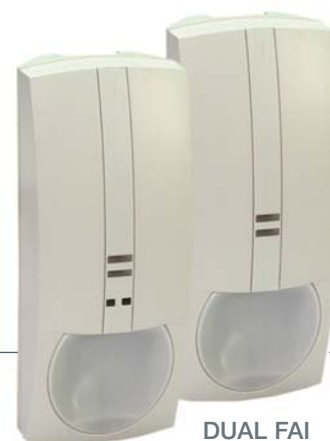
DUAL AM FAI